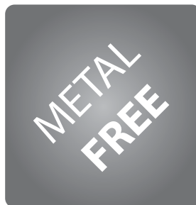
obuv bez kovových součástí metal free footwear obuwie bez elementów metalowych